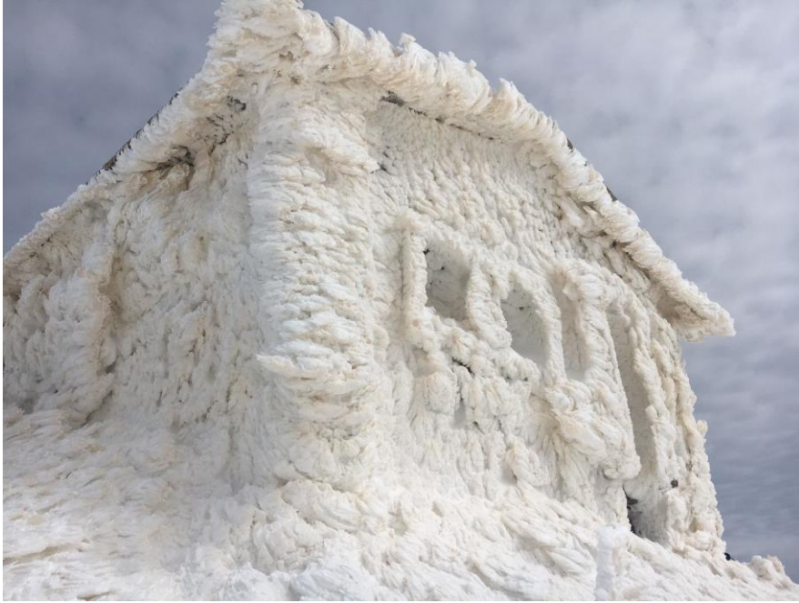
Il a soufflé un peu