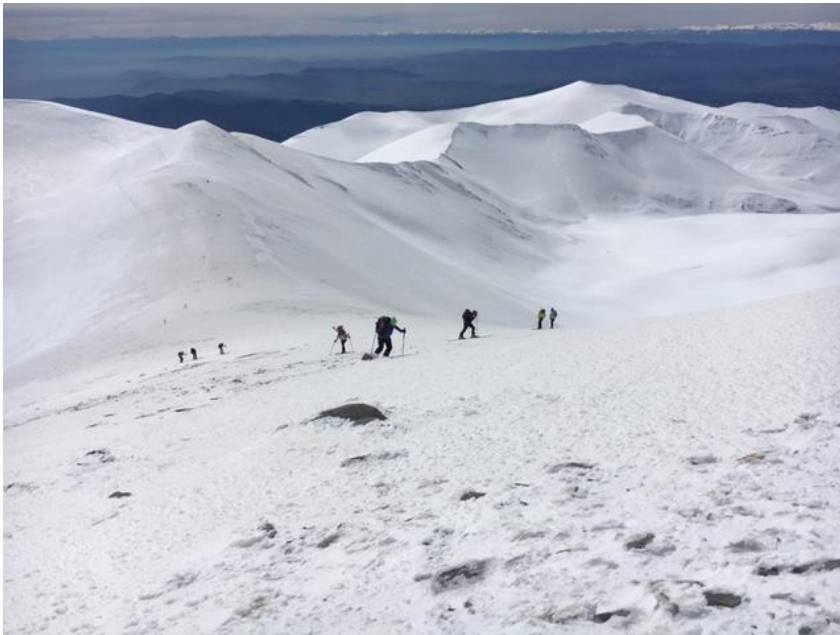
Les sommets du Mont Olympe, 2900 m